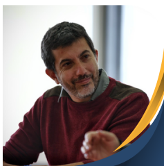
JUAN MANUEL SANTOS