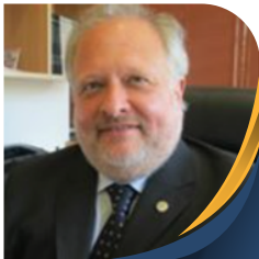
ALFREDO DI PIETRO